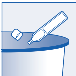
3. Ne upotrebljavajte ponovno! (Nakon upotrebe bacite)